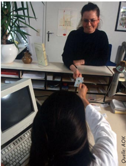
Viele Ärzte erwarten beschleunigte Arbeitsprozesse durch eHealth-Anwendungen

Drei Viertel der Leistungserbringer erwarten, dass sich die Arbeitsprozesse in Praxen und Krankenhäusern durch eHealth-Anwendungen künftig beschleunigen werden. Das geht aus der Studie „eHealth in Deutschland“ der Fachhochschule Flensburg und der Gemini Executive Search hervor.