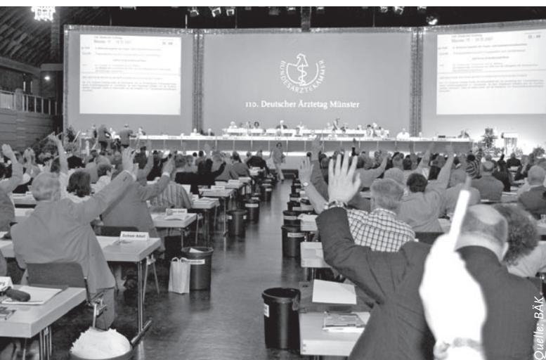
Die Delegierten des 110. Deutschen Ärztetages lehnten die Gesundheitskarte in der bisher vorgestellten Form ab

Der 110. Deutsche Ärztetag in Münster hatte im Mai dieses Jahres die Einführung der elektronischen Gesundheits-